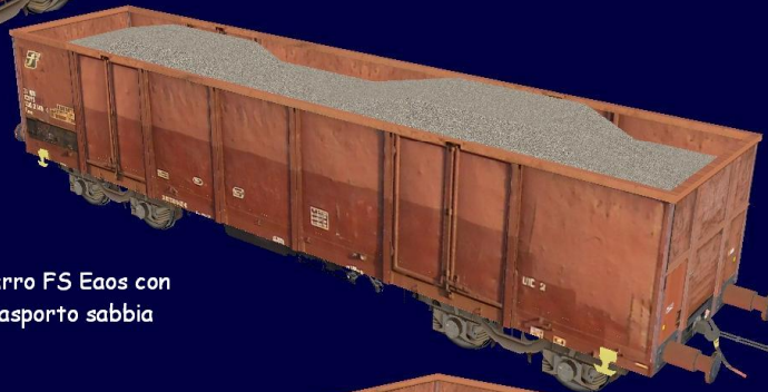
Carro FS Eaos con trasporto sabbia