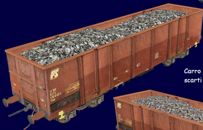
Carro FS Eaos con trasporto scarti di ceramica