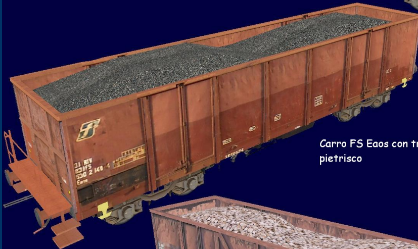
Carro FS Eaos con trasporto pietrisco