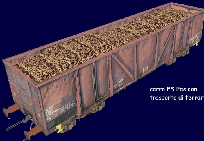
carro FS Eaos con trasporto di ferrame