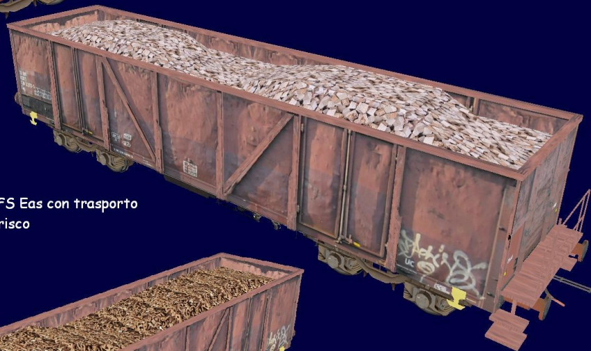
Carro FS Eaos con trasporto di pietrisco