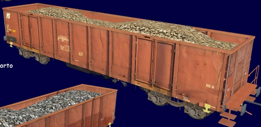
Carro FS Eanos con trasporto pietrisco