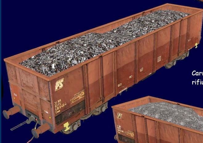
Carro FS Eaos con trasporto rifiuti