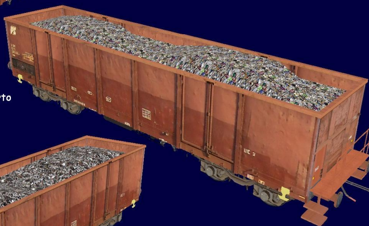
Carro FS Eaos con trasporto lattine pressate