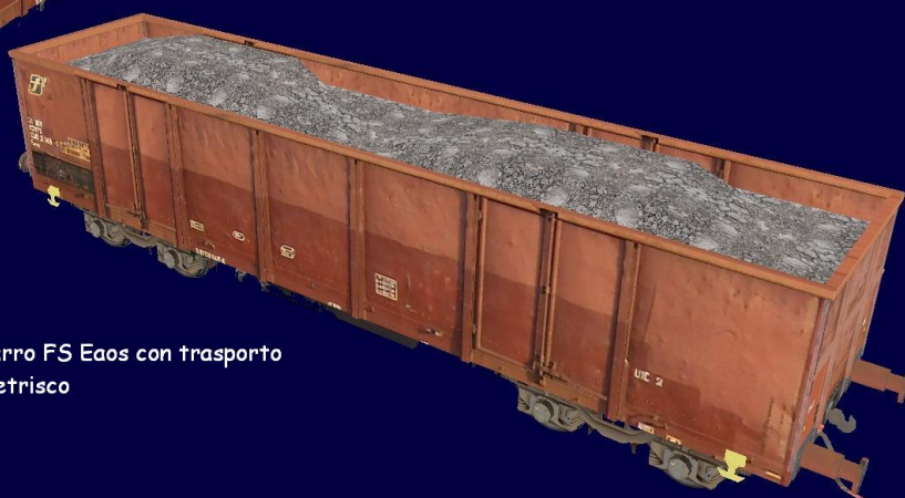
Carro FS Eaos con trasporto pietrisco