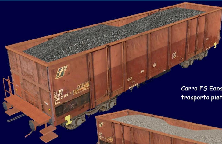
Carro FS Eaos con trasporto pietrisco